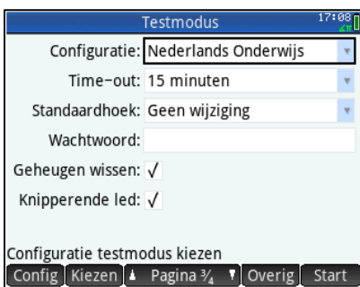
Figuur 1: Examenstand ingesteld op de Prime rekenmachine.

Leraren en examinatoren kunnen gemakkelijk alle door de gebruiker ingevoerde content verwijderen voor aanvang van elke test of examen: