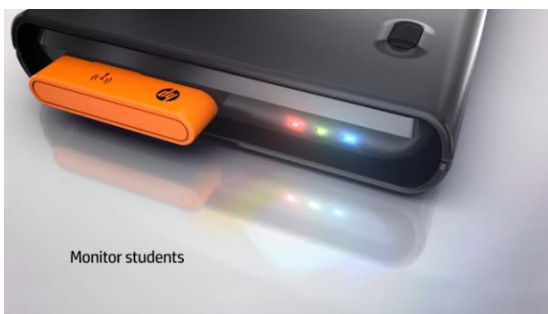
Figuur 3 Examen Modus lampjes knipperen in unieke volgorde

Controle tijdens een examen wordt erg makkelijk met de HP Prime Examen Modus. De LED lampjes op elke rekenmachine knipperen in een cryptografisch uniek patroon gebaseerd op de Examen Modus configuratie en het gekozen wachtwoord. Dit patroon zal hetzelfde zijn voor alle HP Prime rekenmachines die deze configuratie volgen.